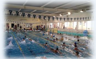
昨年度の活動の様子