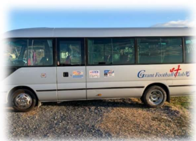
Grant バス 29名乗り