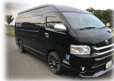
Grant ハイエース 14名乗り