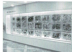
ROX 5F ファミリーギャラリー

入賞した作品は2022年12月10日(土)～2023年1月9日(月・祝)の期間、ROX 5F ファミリーギャラリーにて展示、ROXホームページにて掲載させていただきます。