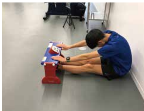
長座体前屈 (やわらかさ)