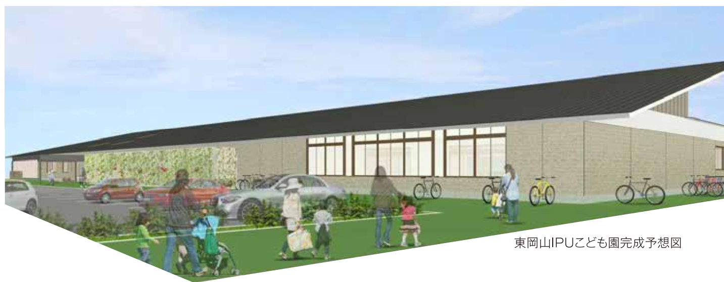
東岡山IPUこども園完成予想図