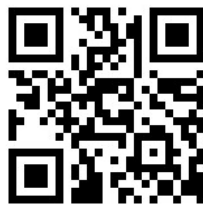
冒険クラブ QRコード

5/16 (日) まこと、舟渡、あさひ 香取、牛久フレンド、 きぬ、絹西、高塚、入間