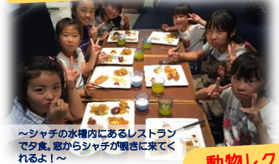
～シャチの水槽内にあるレストランで夕食。窓からシャチが覗きに来られるよ！～