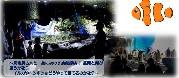
～飼育員さんと一緒に夜の水族館探検！屋間と何が違うかな？イルカやペンギンはどうやって寝てるのかな？～