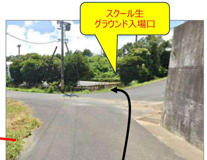
坂を下った先 ゲート(グラウンド入場口)から入る