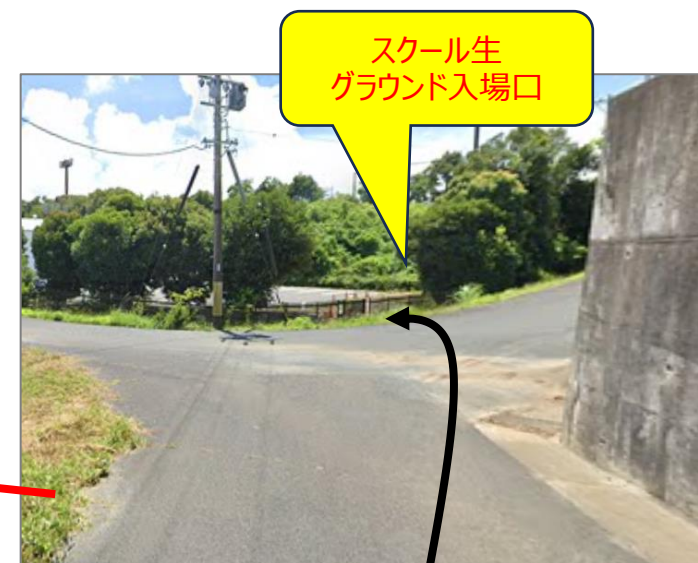
坂を下った先 ゲート(グラウンド入場口)から入る